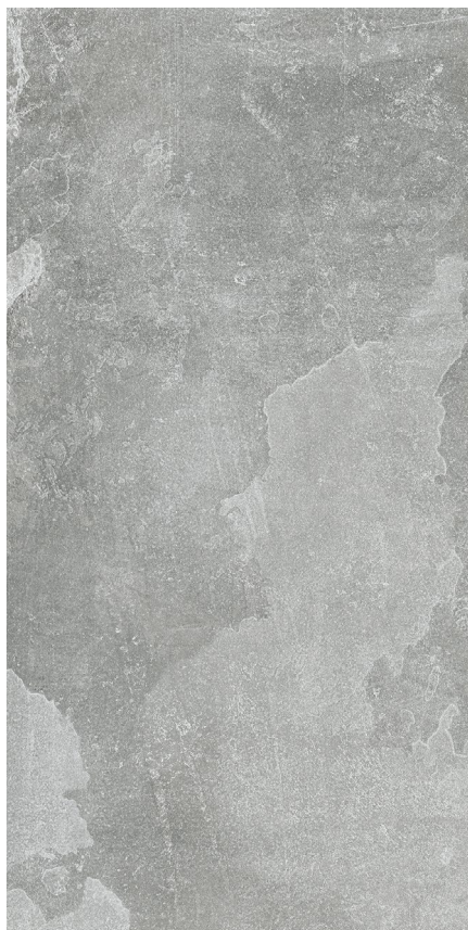
30 x 60 cm (11.82 x 23.63) EX.LP.GRY.1224.MT