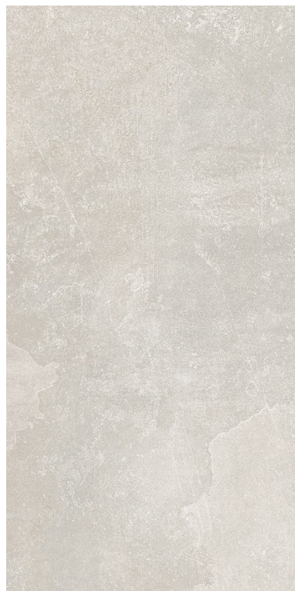
30 x 60 cm (11.82 x 23.63) EX.LP.BGE.1224.MT

Tous les items présentés dans ce document font partie du programme d'inventaire Olympia. Pour les commandes spéciales, veuillez contacter votre représentant de Tuiles Olympia.