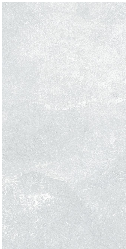
30 x 60 cm (11.82 x 23.63) EX.LP.WHT.1224.MT