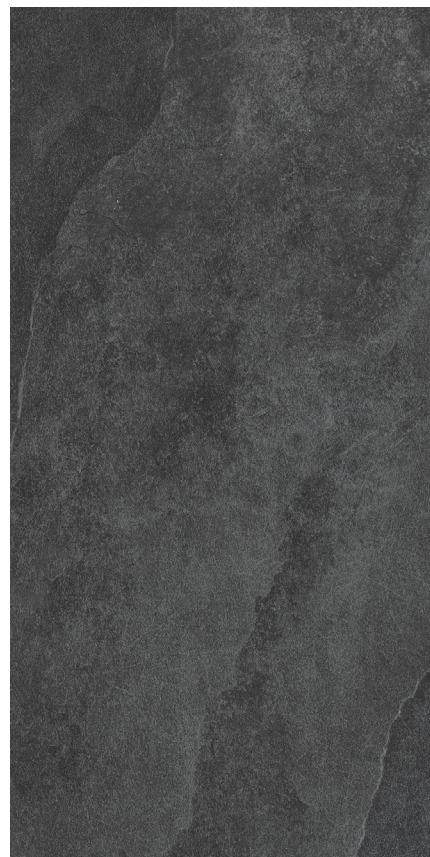
30 x 60 cm (11.82 x 23.63) EX.LP.ANT.1224.MT

Tous les items présentés dans ce document font partie du programme d'inventaire Olympia. Pour les commandes spéciales, veuillez contacter votre représentant de Tuiles Olympia.